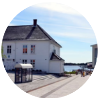
SORENSKRIVERGÅRDEN STORGT. 1, 4876 GRIMSTAD

GNF er samlokalisert i 1. etg i Sorenkrivergården i sentrum sammen med Grimstad Min By, Visit Grimstad og kommunens næringsavdeling.