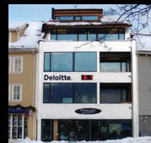
Deloitte Grimstad Arendalsveien 2 4878 Grimstad 38 12 27 22

Sammen med deg finner vi de beste løsningene.